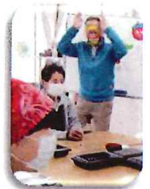
年男が鬼に、参った退散だ！

4月5日（土）10時から 地域会館の広場 抹茶無料です。 皆様のお越しをお待ち しています。