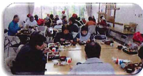
ボランティア手作りの美味しい食事を頂きました