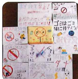
部員たちの思いです