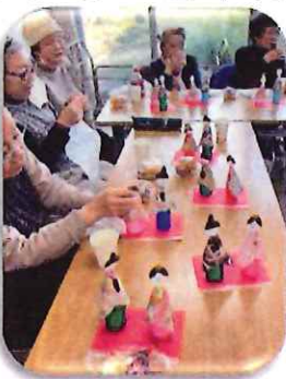
ぶらぶら散歩の会でお雛様を作りました