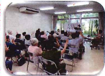
身体も使って歌っています