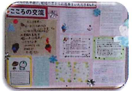
小学校には、高齢者方からの御礼のお手紙が掲示されています

特に、「今習っている九九が難しい」といった児童らしいエピソードが書かれています。この手紙に対して地域からも小学校へ返信があり、「こころの交流」として校長室前の掲示板に掲示されています。