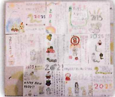
お返事もたくさん頂きました 20年以上続けている心の交流です