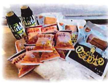
配布した食品の一例です

今回は開催が例年より2か月遅れてしまいました。寒い中、並んでくださった皆さまにはご不便をおかけし、申し訳なく思っています。歩行が困難な方や、病気ゆけがで受け取りが難しい場合は、民生委員、包括支援センターの職員が、ご自宅まで食料をお届けすることも可能です。次回以降お気軽にご相談ください。