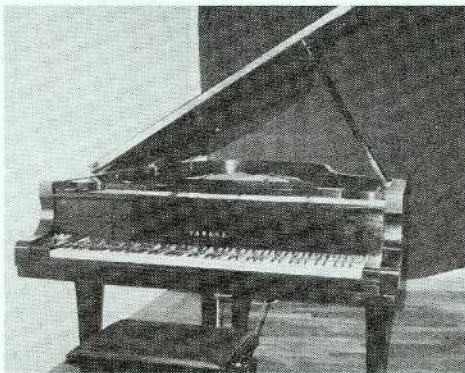
寄贈されたピアノ

委員会の連名で、コンサート用ヤマハC7ピアノを寄贈いたしました。併せてピアノ・レンタル料節約の意味もあります。例年ピアノのレンタル料が音楽会運営費を圧迫してきました。そこで、この際思い切ってピアノを寄贈することにしたのです。一月三日の音楽会はピアノ開きを兼ねています。ぜひご来会ください。寄贈されたピアノ