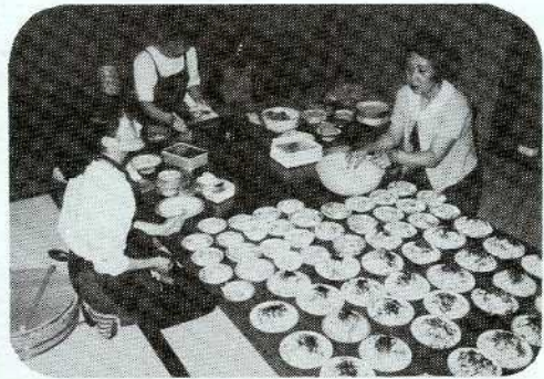
笹にねがいをこめて

七月五日(日)校区自治会館で、敬老七夕の集い(昼食会)が三三名の参加でなごやかに行われました。主催は校区ボランティア企画委員会とボランティア・グループ「赤坂ほのぼの会」。 それぞれの願いを書いた短冊を笹竹に結び、楽しい三時間でした。