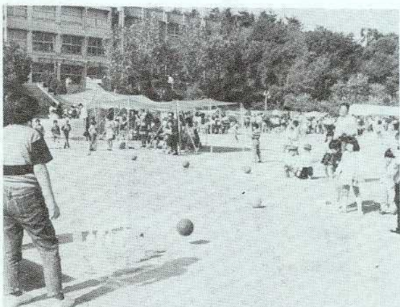
(写真は昨年の第五回カーニバル)