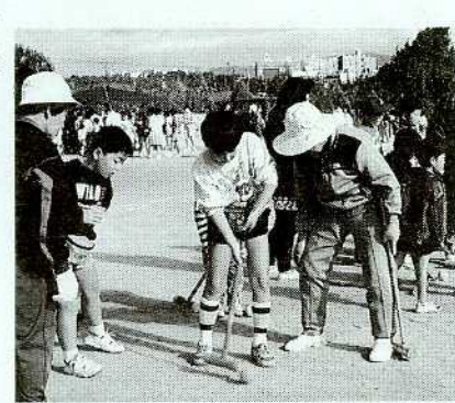
〔連合子ども会 育成協議会 役員〕

実行委員会では「子ども達 自身が自分達の考えを生かし て楽しみを作り上げていく」 ことを目指して話し合いを進 めていきました。