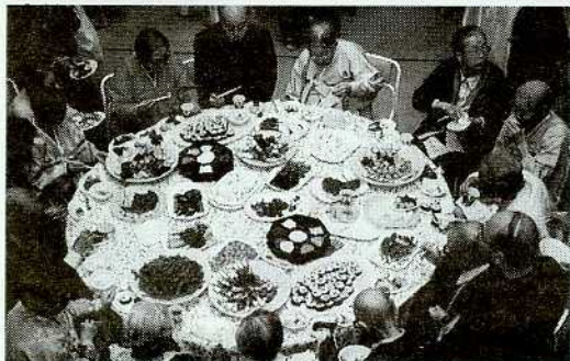
(食卓に並んだ韓国料理を囲んで)

十一月二十六日、韓国人老人ホームでコリアンデイが催されました。同ホームにボランティニア活動を続けている「ほのぼのの会」の方々もご招待を受けて参加しました。以下は、参加した明星さんの手記。