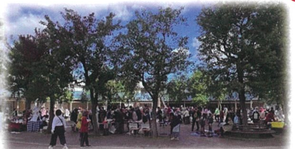
たくさんの方が楽しみました