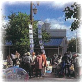
フリーマーケット、 売り手も買い手も楽 しみました

秋晴れのもと、ふれあい広 場を開催しました。バザー に代わり初めての試みで したが、子どもから高齢者 まで、大勢の方で賑わいま した。収益金(49,04 5円)はボランティア活動 に使わせて頂きます。沢口 靖子さんコーナーをはじめ め、ご協力頂いた多くの皆 様に感謝いたします。