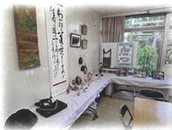
地域会館では高齢者の作品展も