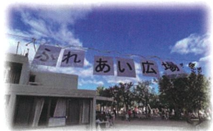
嬉しそうに風になびいています