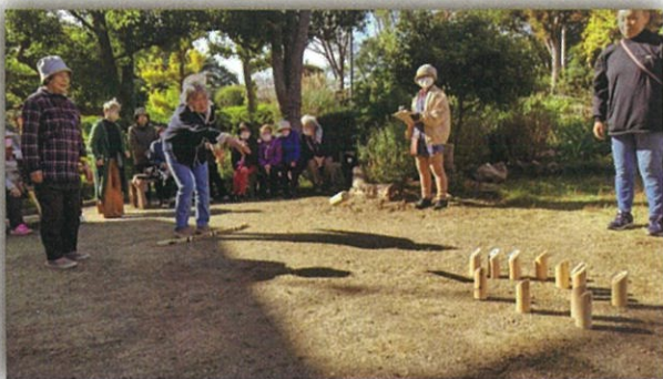
色々頭を使いながら投げました。