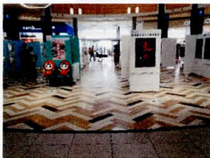
▲ 平和と人権展の様子